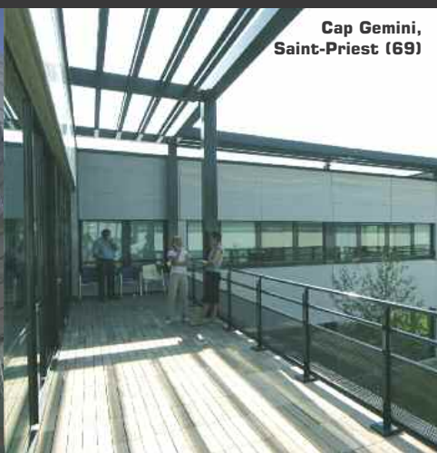
Cap Gemini, Saint-Priest (69)