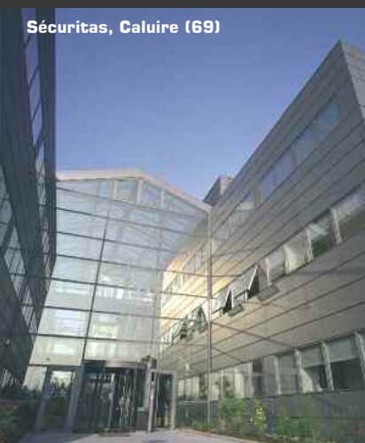
Sécuritas, Caluire (69)