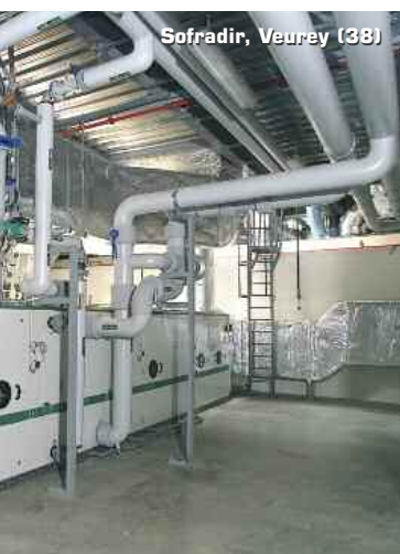
Sofradir, Veurey (38)