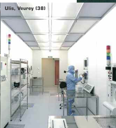
Ulis, Veurey (38)