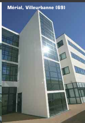
Mérial, Villeurbanne (69)