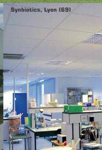
Synbiotics, Lyon (69)