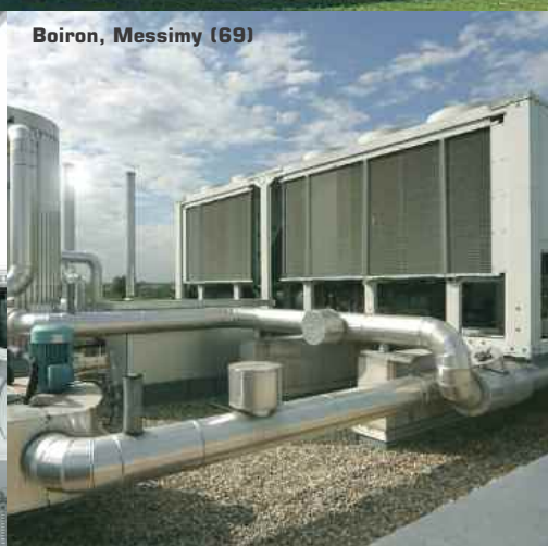
Boiron, Messimy (69)